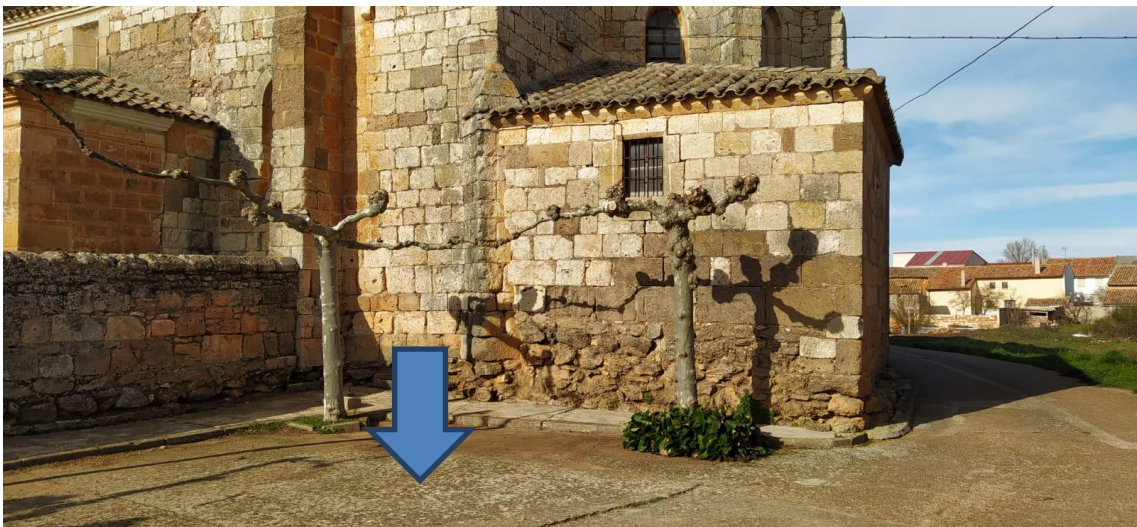
Lugar donde estuvo el cementerio con sus piedras.