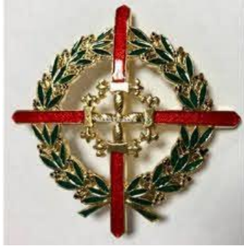
Cruz laureada de san Fernando.