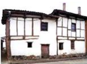
Casa del maestro y escuela en 1948

Conscientes, las autoridades locales, de este problema, trataron de solucionarlo. Consultaron con la Inspección Técnica de Enseñanza de Burgos y acordaron hacer un grupo escolar nuevo al que irían las niñas, dejando el existente para los niños. Entre trámites y construcción, en el verano de 1950 estaba terminada la «Escuela de las niñas».