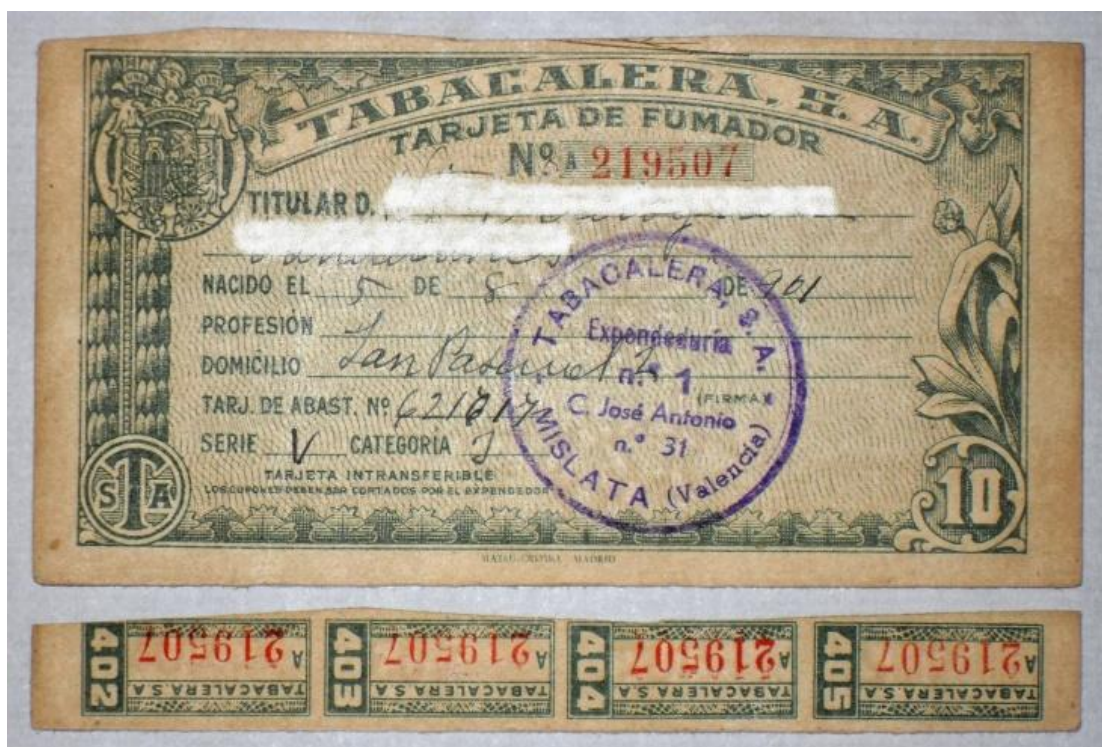
La "cartilla" del tabaco: tarjeta de fumador con sus cupones.

Entre los solicitantes de la cartilla de racionamiento de tabaco había bastantes no fumadores que utilizaban su ración para revenderla, o bien para dársela a un familiar, generalmente el padre, el abuelo o un hermano mayor, que fuera gran fumador.