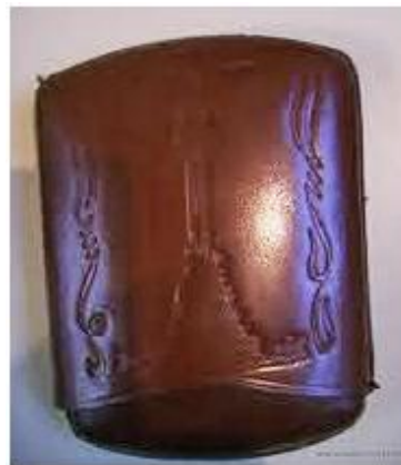
Cerillas, chisquero y petaca