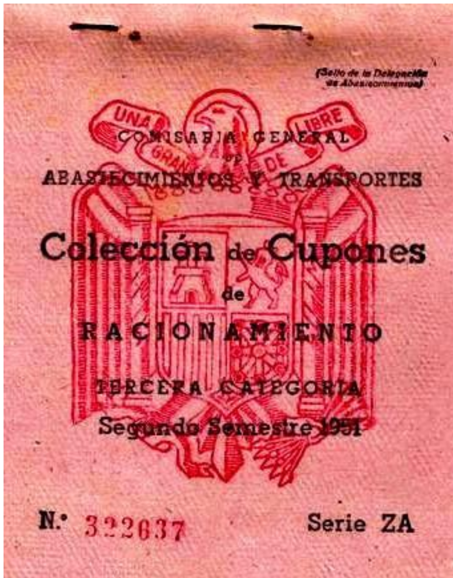
Cartilla de Racionamiento con los cupones.

El día del ceremonial del reparto era muy curioso. Aquello parecía un pequeño supermercado. Las mujeres en la cola en respetuoso orden. A la llegada de su turno, pedida de alimentos, corte en la cartilla de los cupones gastados, pagos de los cupones y hasta el mes que viene.