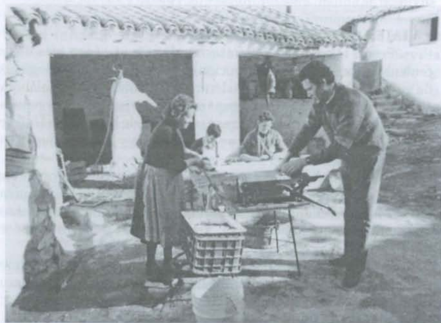
Una matanza en Noez.

Durante la fase de gorrino, guarrito, tostón, lechal; y en una fase posterior de cerdo al destete, después de haber pasado por un momento de ruin o nacimiento raquítico, durante varios meses se ha