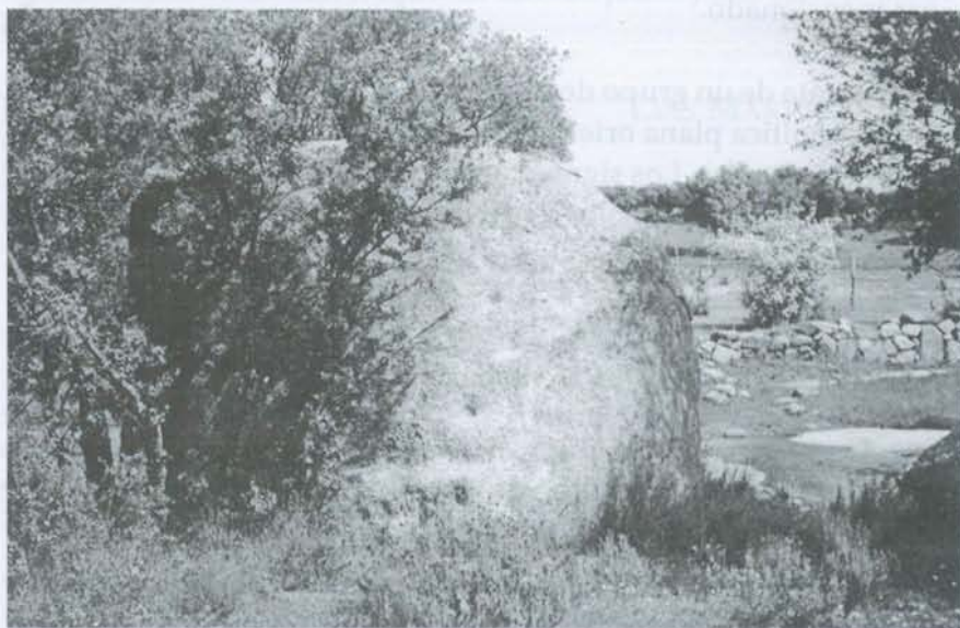
"Canto de la escalera". Arroyo Jimena entre Navahermosa y Menasalbas.

cercano abrigo y la fácil defensa que para estos grupos humanos posiblemente cazadores, les facilita las dos moles aisladas de cuarcitas que singularizan el lugar, hacen de este enclave una estación prehistórica merecedora de nuestra atención. A ello le sumaremos lo que puede suponer una nueva aportación. Se trata de unas concreciones ferruginosas en la cara este del llamado Risco, cuyas formas nos están indicando la presencia de la mano del hombre y que tendrán que examinar los expertos.