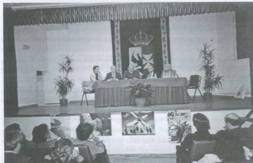
Intervención del Presidente de la A.C. Montes de Toledo.