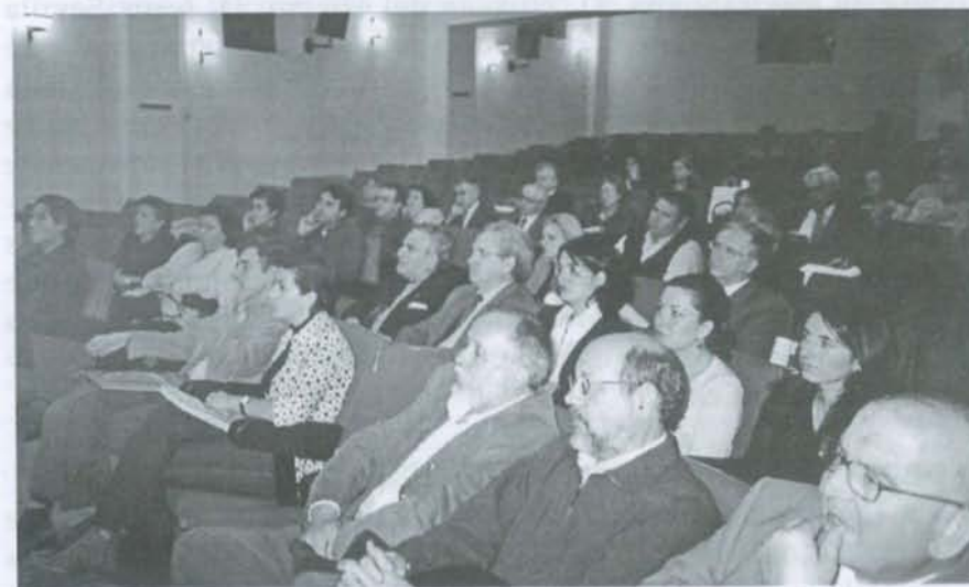
Asistentes al acto.