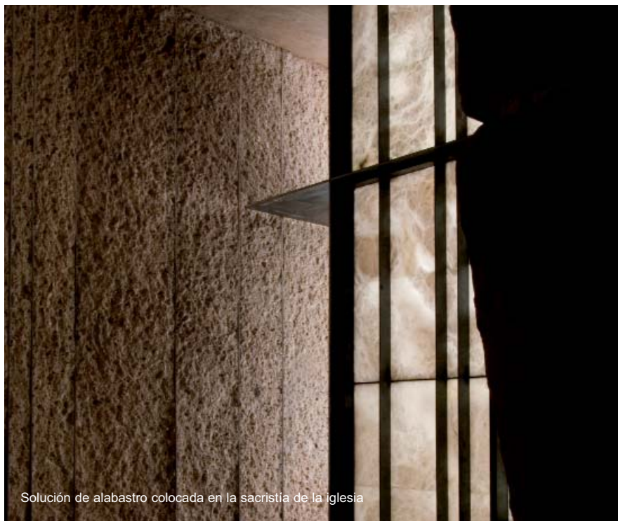
Solución de alabastro colocada en la sacristía de la iglesia

ción y redacción de proyectos, comenzó el proceso de restauración, que en este caso se inició con el desescombros de la iglesia y el acondicionamiento de los accesos.