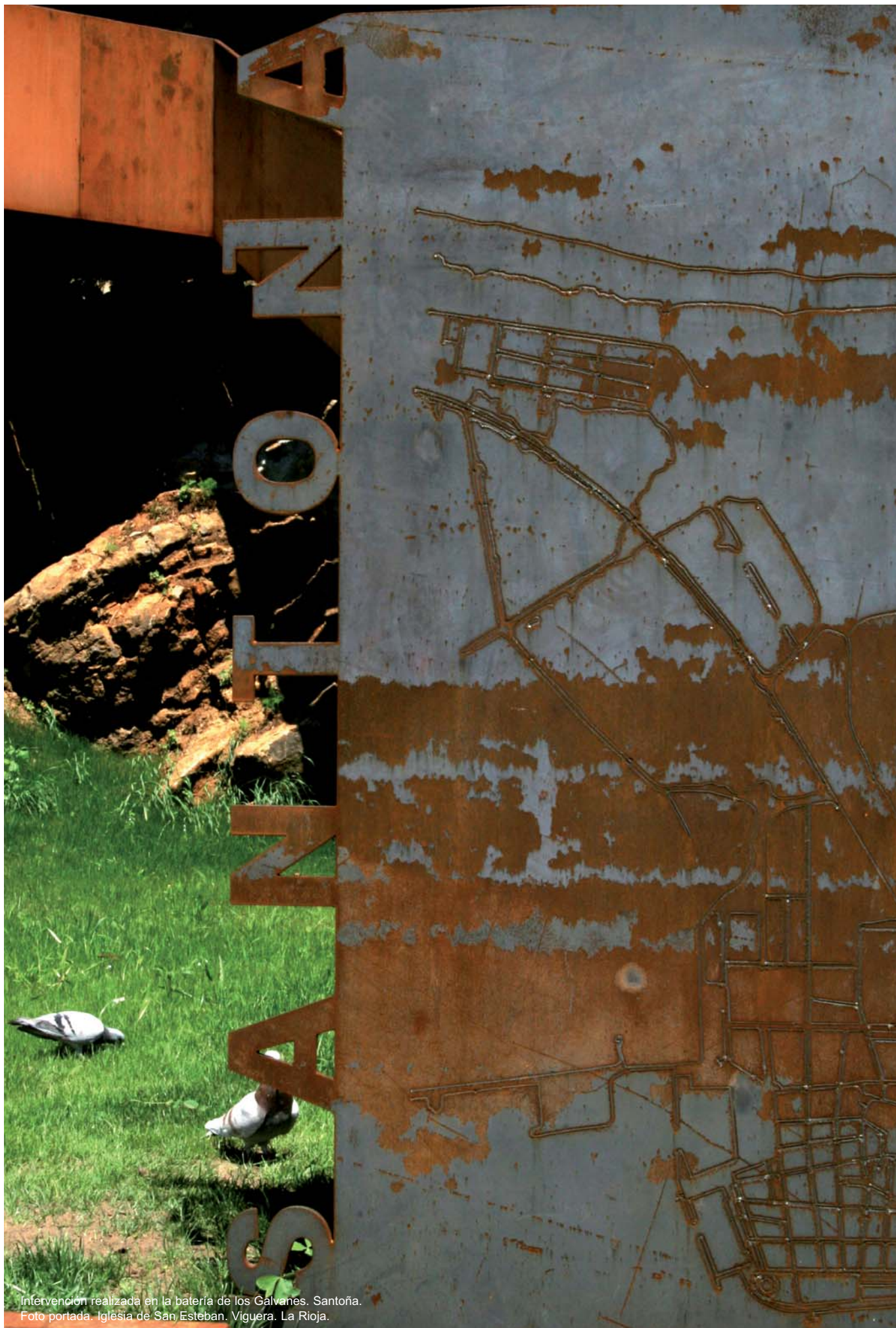
Intervención realizada en la batería de los Galvanes. Santoña. Foto portada. Iglesia de San Esteban. Viguera. La Rioja.