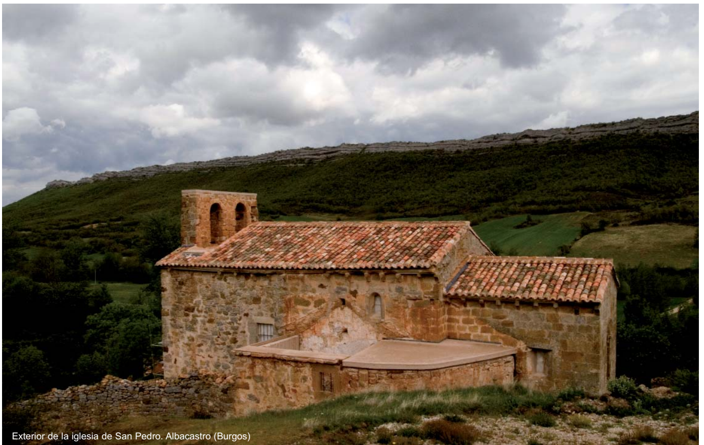
Exterior de la iglesia de San Pedro. Albacastro (Burgos)

Tras varios meses de estudio, investiga-