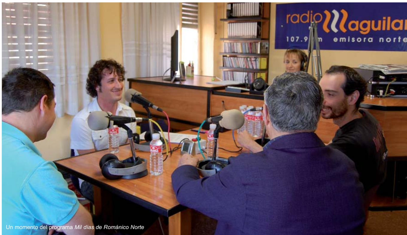
Un momento del programa Mil días de Románico Norte

Las actividades de comunicación del Plan de Intervención Románico Norte comenzaban en 2008 un nuevo rumbo, coincidiendo con el con paso del ecuador del programa. En este sentido, se iniciaba una amplia campaña que con el nombre “Mil días de Románico Norte” pretende lograr una mayor difusión de los valores y actividades del Plan, llegando a capas más amplias de la sociedad e incidiendo para ello en las nuevas tecnologías de la comunicación y en los canales multimedia.