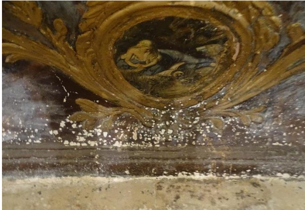
Ilustración 1.-Salpicaduras de morteros