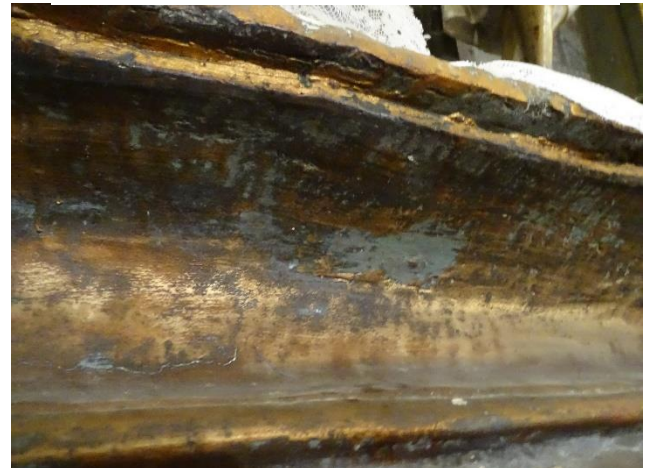
Ilustración 3.-Capas de protección alteradas