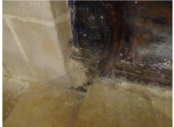
Ilustración 2.-Recubrimiento con morteros