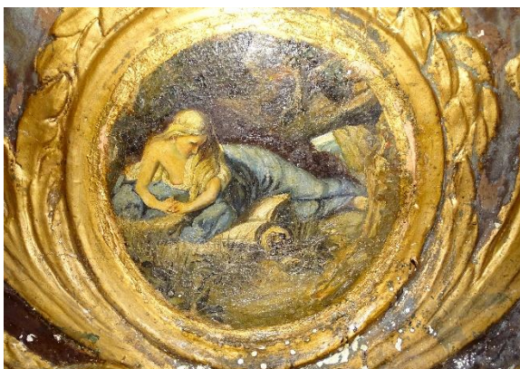
Ilustración 6.- Falta de adhesión del cuero y repolicromados