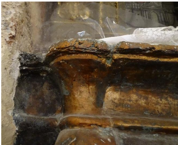
Ilustración 5.-Pérdida volumétrica por acción de xilófagos