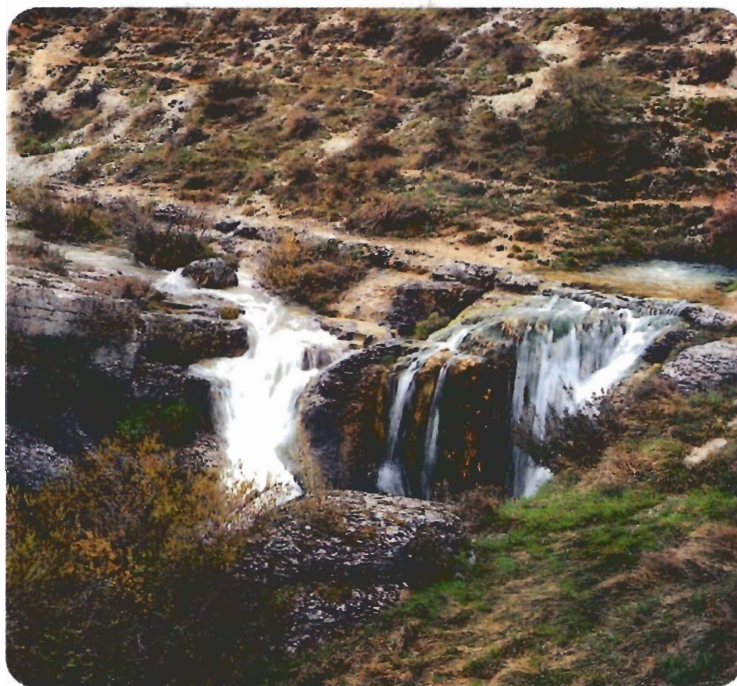
A la izquierda, la Fuente Manapites. A la derecha, una vista de la cascada de La Yeguamea.

EL RÍO ODRÁ, MODESTO AFLUENTE DEL PISUERGA, TIENE SUS FUENTES EN EL MISMÍSIMO CORAZÓN DE LAS LORAS