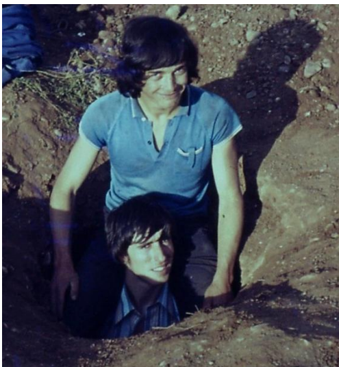
Silo celta hallado en Villamar