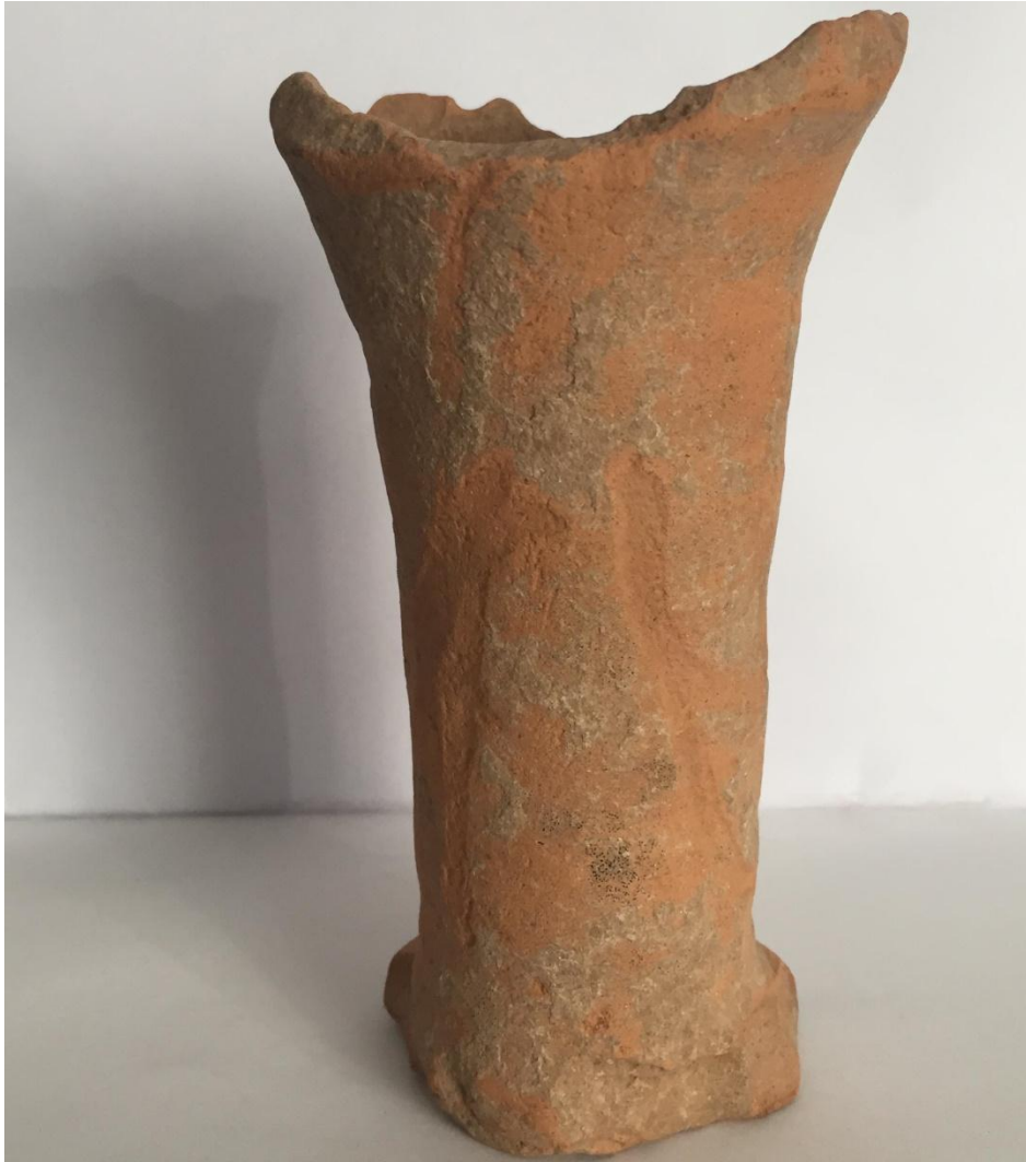
Base de ánfora