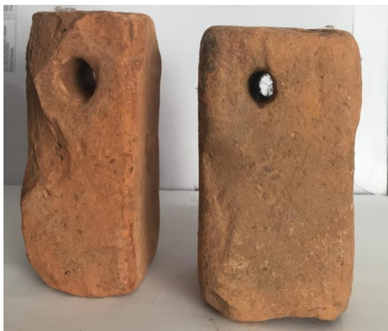
Pondus de telares.