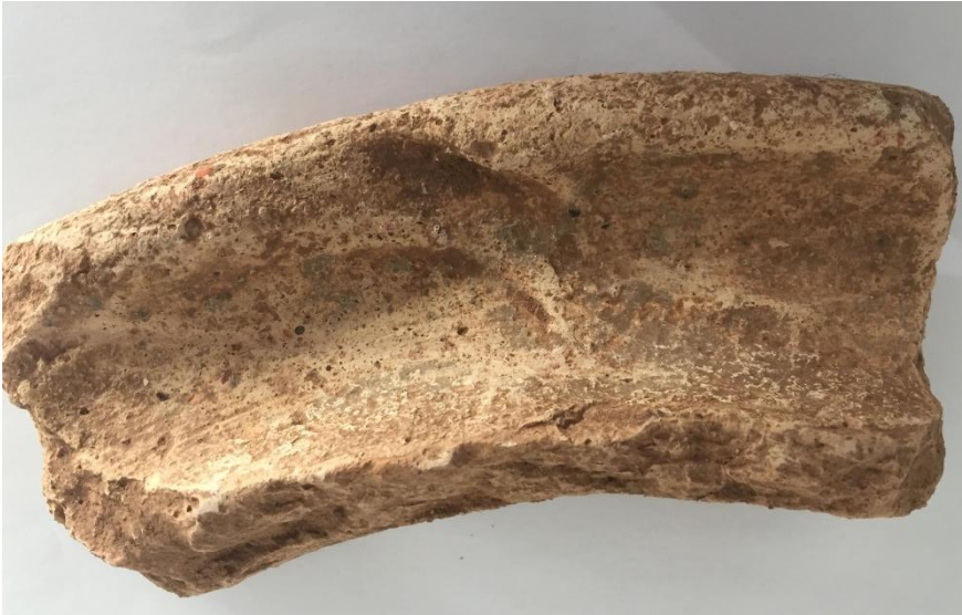
Brocal de vasija