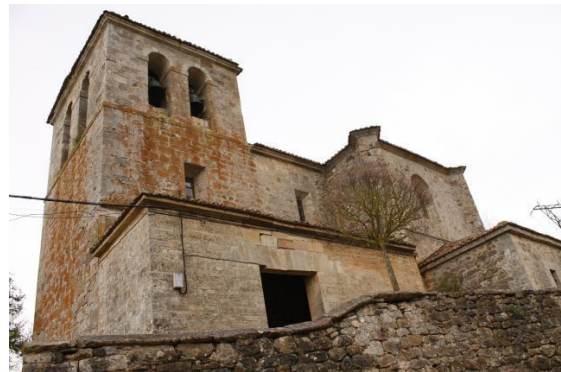
Barrio de Santa María, actualmente Ordejón de Abajo