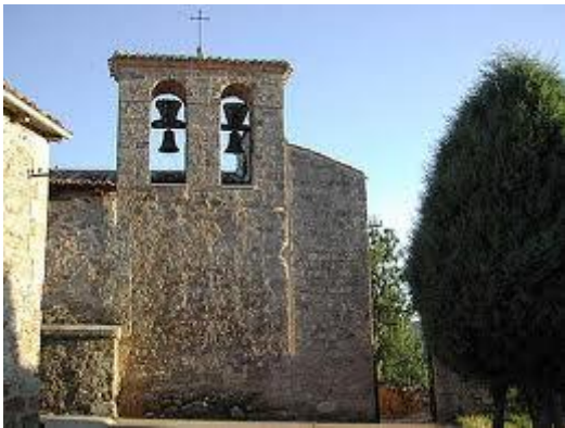
Barrio de San Juan, hoy Ordejón de Arriba