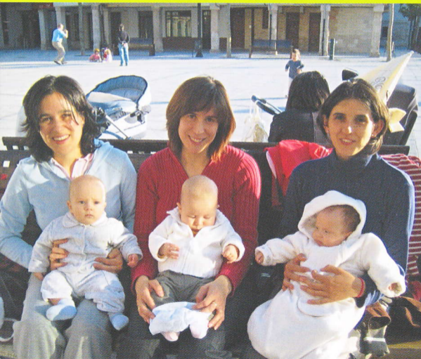
MADRES E HIJOS EN LA PLAZA MAYOR