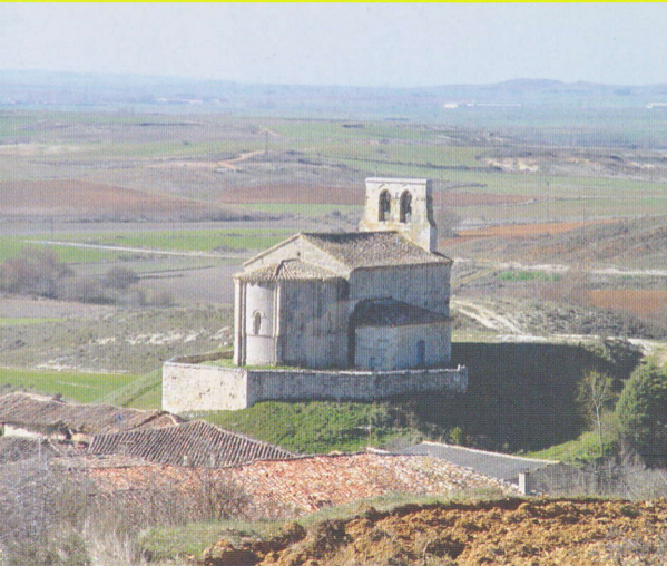
IGLESIA DE LA ASCENSION DE BOADA