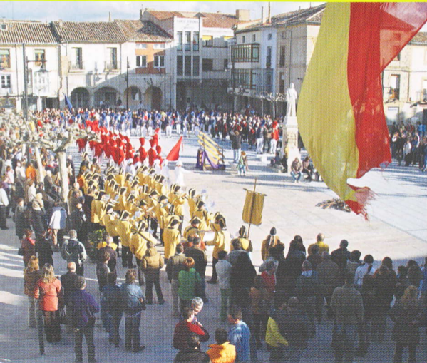
FIESTA DEL JUDAS: 22 DE MARZO