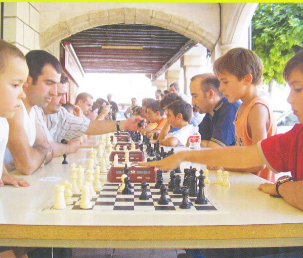
CAMPEONATO DE AJEDREZ