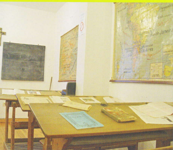
MUSEO MUNICIPAL - SECCIÓN ETNOGRÁFICA - ESCUELA