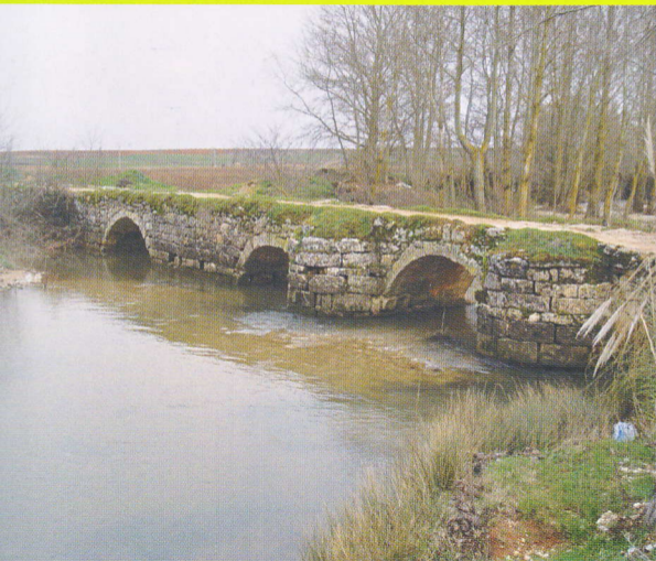
PUENTE ROMANO DE SANDOVAL DE LA REINA