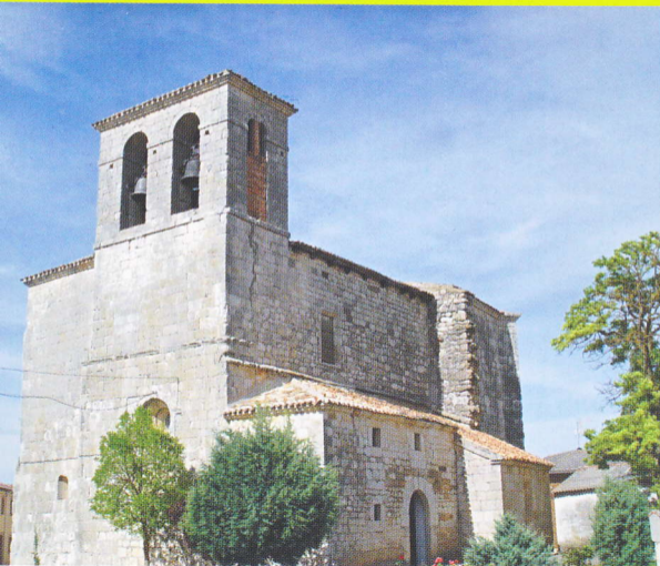
IGLESIA DE SAN MARTÍN DE VILLAVEDÓN.