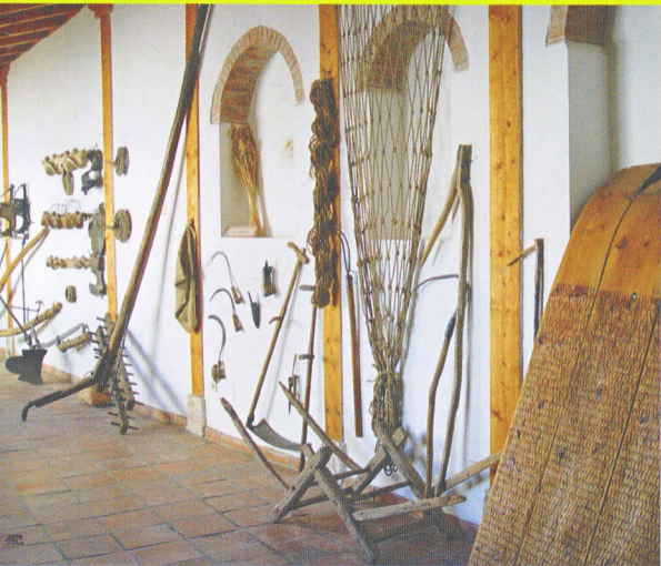
MUSEO MUNICIPAL. SECCIÓN ETNOGRÁFICA. EL CAMPO