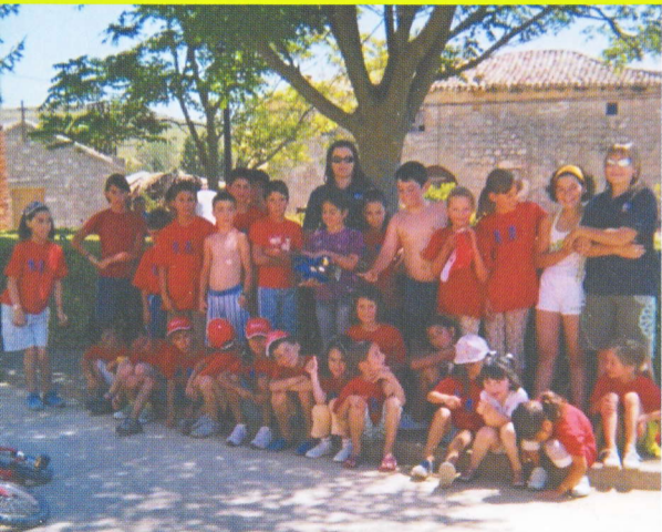
CRECEMOS EN VERANO: CASTROMORCA EN BICLI.