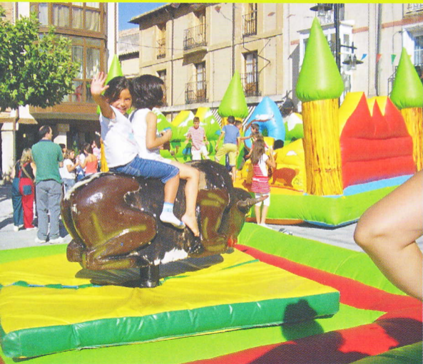
JUEGOS INFANTILES E HINCHABLES.