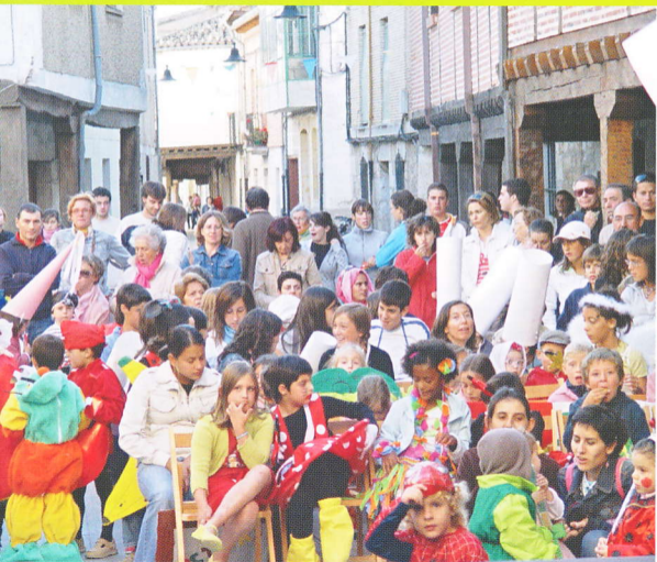
CONCURSO DE DISFRACES