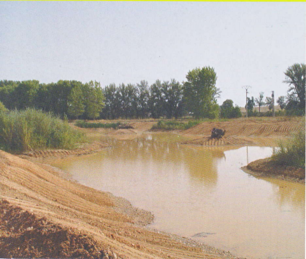
LAGUNILLA DEL CUADRÓN