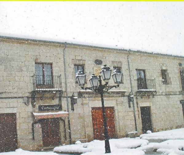
PALACIO DEL CONDESTABLE