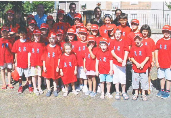
CRECEMOS EN VERANO