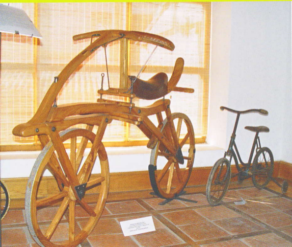
MUSEO MUNICIPAL VELOCÍPEDOS.