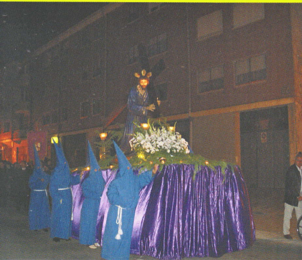
SEMANA SANTA: PROCESIÓN DE VIERNES SANTO